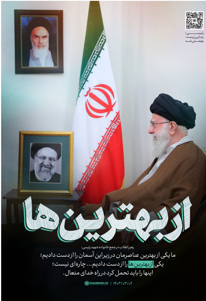
رهبر انقلاب در جمع خانواده شهید رئیسی

ما یکی از بهترین عناصرمان در زیرین آسمان را از دست دادیم؛