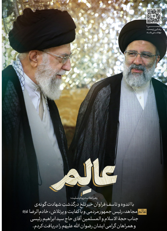
با اندوه و تاسف فراوان خبر تلخ درگذشت شهادت گونه ای عالم مجاهد، رئیس جمهور مردمی و پاکفایت و پرتلاش، خادم الرضا جناب حجة الاسلام و المسلمین آقای حاج سید ابراهیم رئیسی و همراهان گرامی ایشان رضوان الله علیهم را دریافت کردم.

حزب مؤتلفه اسلامی استان قزوین ضمن عرض تسلیت شهادت آیه الله دکتر رئیسی، ریاست جمهوری اسلامی ایران و همراهان به پیشگاه مقدس حضرت بقیه الله الاعظم امام زمان (عج)، رهبری معظم انقلاب حضرت آیه الله العظمی امام خامنه ای (حفظه الله)، خانواده های داغ دیده و عموم ملت صبور ایران، از همه مردم، احزاب و جناح های سیاسی می خواهد که با توجه به فضای همدلی و اتحادی که بواسطه حادثه اخیر و غم شهادت رئیس جمهور خادم ملت، بین آحاد مردم و بر قلب ها حاکم شده، با بصیرت و حضور آگاهانه خود پای صندوق های رأی، که بزودی با برگزاری انتخابات زودرس دوره چهاردهم ریاست جمهوری رقم خواهد خورد، ضمن تداوم راه خدمتگزاری شهید دکتر رئیسی، برگ زرین دیگری بر کارنامه پر افتخار خود بیفزایند تا همچون حوادث اوایل انقلاب و غم از دست دادن بزرگان انقلاب و نیز ایام رحلت امام خمینی (ره) بنیانگذار جمهوری اسلامی، به جهانیان ثابت نمایند که این انقلاب، قائم به اشخاص نیست بلکه قائم به اسلام، امامت، حضور مردم و عقلانیت فطری انسان هاست.