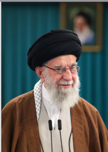
همین قدر با قدرت و تهاجمی!

۵- از ظهر همان روز، سران کشورهای مختلف به نوبت می آیند برای عرض تسلیت. ولی او برای «تسلیت و عزا» ننشسته است. جلسات، «کاری» می شود! نقطه اشتراک و تاکید صحبت هایش، ادامه ارتباطات و تقویت آن است. با اطلاعات همیشگی اش در مورد کشورها و اخبارشان صحبت می کند. حتی برای «اسماعیل هنیه» درس تفسیر می گذارد که از دو وعده الهی یکی اش مانده و آن هم «تابودی اسرائیل» است و شما آن را خواهید دید! با سران ۷ کشور جلسه ی پشت سرهم دارد، شب هم به خانواده رئیس جمهور سر می زند.