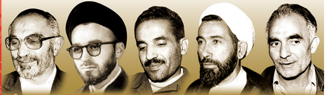
شهید اسدالله لاجوردی