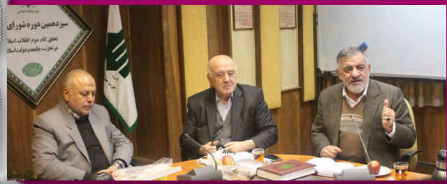
سردیس هیات مدیره شورای عالی ورزش در جلسه هیات مدیره

وی در پایان تصریح کرد: مدیریت در وزارت ورزش با این حجم از مشکلات به مفهوم آن است که اقدام و عمل دوستان در این حوزه انتظارات را بر آورده نکرده و تردید نداشته باشید قاطبه نمایندگان مجلس خواهان تحول در عرصه برخی مدیریت ها هستند. در همین راستا باید اذعان کرد ما نیروهای خوبی هم در حوزه ورزش و هم در حوزه مدیریت کشور داریم که در صورت لزوم می توانند این بخش را بهتر