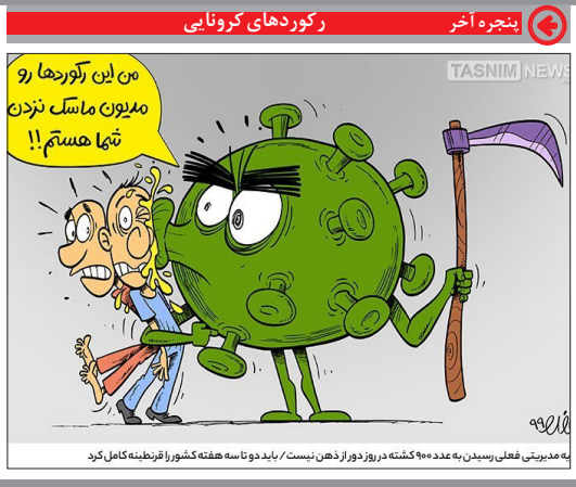
به مدیریت فغانی رسیدن به عدد ۹۰۰۰ کشته در روز از ذهن نیست / باید دو تا سه هفته کشور را قرنطینه کامل کرد