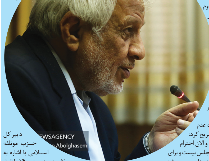
NEWSAGENCY Mohsen.Abolghasem دبیر کل حزب موتلفه اسلامی با اشاره به لایحه بودجه ۱۴۰۰، اظهار

داشت: ما تحلیل خود درباره بودجه را در جلسه فراکسیون حزب موتلفه اسلامی به نمایندگان مجلس یازدهم ارائه داده ایم تا نمایندگان از دولت بخواهند بودجه را اصلاح کنند و نظر ما در فراکسیون حزب هم باز گرداندن لایحه بودجه است نه رد بودجه و این بودجه هم برای دولت و کشور مشکل درست می کند.